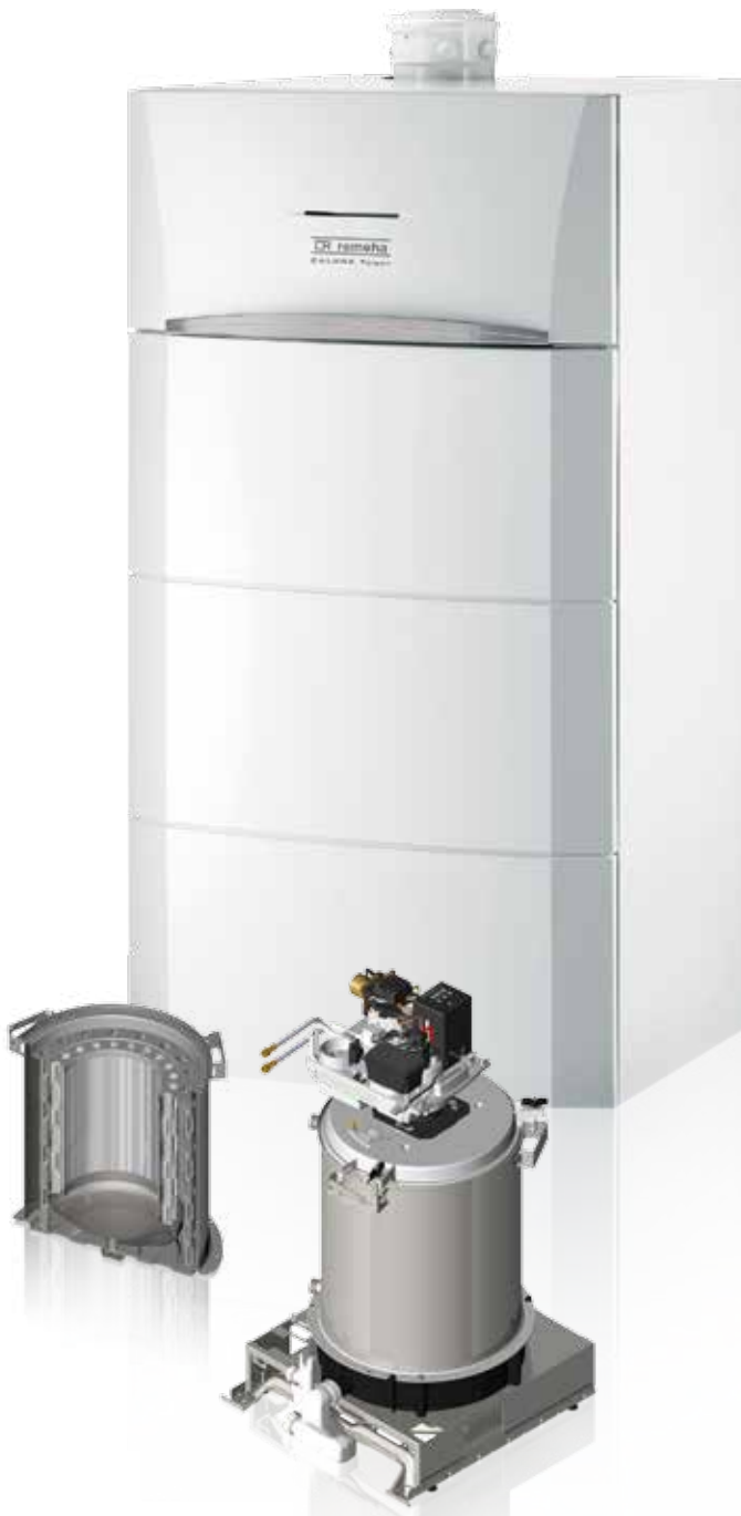
Calora Tower Öl mit Wärmetauscher