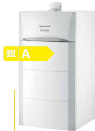
Calora Tower Öl Solo